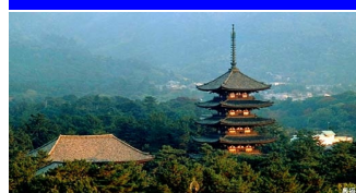
古都奈良の文化財