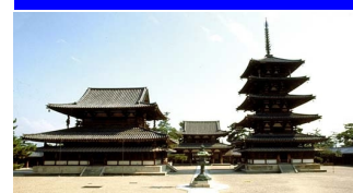
法隆寺地域の仏教建造物